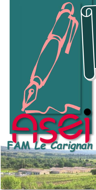
Vue du FAM