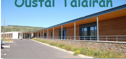
Vue de l' Ehpad