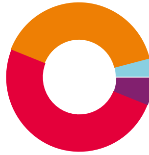
Répartition des résidents par tranche d'âge