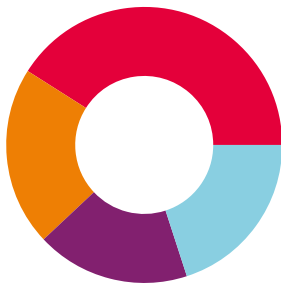
Durée de l'accompagnement sur la structure